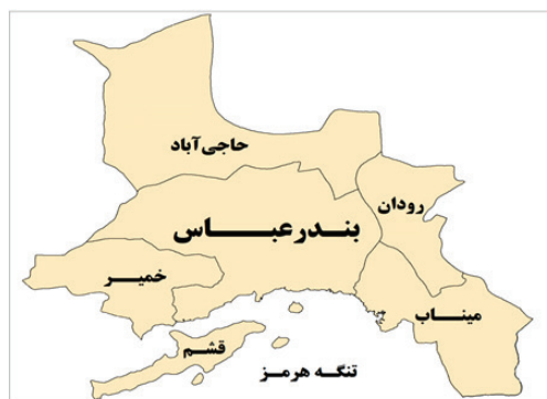
شکل ۲: نقشه موقعیت شهرستان بندرعباس

از آنجایی که با رشد جمعیت شهر، نیاز به گذراندن اوقات فراغت نیز افزایش می‌یابد، برنامه‌ریزی برای آینده در جهت پاسخ به تقاضاها امری ضروری است؛ اما به این دلیل که همواره در زمینه‌ی تأمین اعتبار، صرف هزینه‌های نیروی انسانی و زمان محدودیت‌هایی وجود دارد، ضروری است که مقاصد گردشگری طبیعی اولویت‌بندی شود و براساس میزان تقاضا و اقبال مردم به این مقاصد، توسعه‌ی آنان در اولویت قرار گیرد.