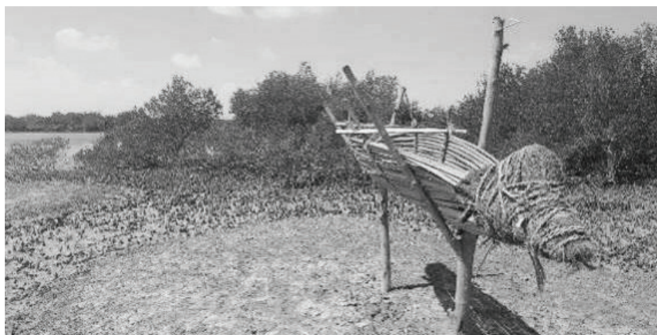
تصویر ۶: قایق شاشک نگهداری‌شده در جنگل حرای روستای گورزین.