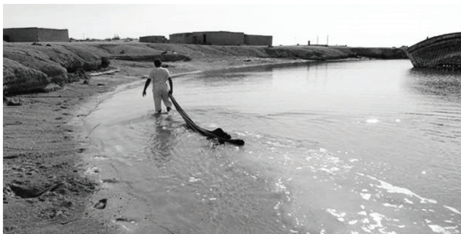
تصویر ۳: قرار دادن گردها در ساحل دریای دیرستان.

است. طبق گفتگوهای مردم‌شناسی، ساقه‌های درخت خرماى مُرسلى - که ضخیم‌تر است - برای ساخت این نوع قایق مناسب‌تر است. به طور کلی، برای ساخت این قایق نخست شاخه‌های درخت خرما را با داس می‌برند، خارها و برگ‌ها را جدا می‌کنند تا ساقه کاملاً لخت شود. سپس ساقه‌های بریده شده را در بسته‌های بیست‌تایی به هم متصل می‌کنند و آن را به مدت یک ماه در ساحل دریا، زیر آب قرار می‌دهند. این کار با هدف نرم کردن ساقه‌ی درخت خرما صورت می‌گیرد (تصویر شماره‌ی ۳). در بندر جاسک برای نرم کردن ساقه‌ی درختان خرما، آنها را به مدت پانزده روز در زیر خاک قرار می‌دهند (کریمیان و همکاران، ۱۳۸۵: ۳۸). سپس قسمت‌های انتهایی ساقه‌ی درخت خرما (کوکور به گویش قشمی) را باریک می‌کنند و گردها را محکم کنار هم قرار می‌دهند؛ البته برای این کار سوراخ‌هایی در ساقه ایجاد و با ریسمان ابریشمی سفیدرنگ، گردها در کنار هم چیده می‌شوند (تصویر شماره‌ی ۴ و ۵).