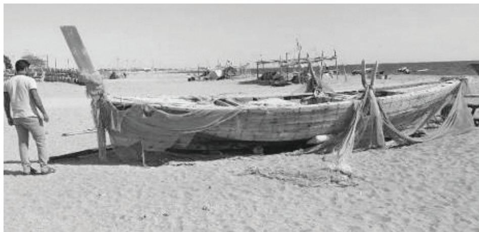
تصویر ۱: قایق زاروگه در ساحل روستای گامبرون.

در طراحی و ساخت قایق‌ها عوامل متعددی نقش دارد؛ چون نیاز اقتصادی، وضعیت اقلیمی، زمین ریخت‌شناسی ساحل، محل پهلوگیری قایق و تأثیرات مذهبی (DionisiusAgius, 2008: 35). همچنین بررسی نوع کاربرد آنها به عنوان قایق‌های رودخانه‌ای یا ساحلی، نکته‌ای مهم در ریخت‌شناسی این وسیله‌ی حمل و نقل آبی به شمار می‌رود. در حوزه‌ی خلیج‌فارس و دریای عمان، قایق‌های بومی متعددی با کاربری‌های گوناگون وجود دارد (همان: ۳۵-۴۳) که در این جا تنها به یک نوع قایق بومی با فناوری ساخت کاملاً ابتدایی در جزیره‌ی قشم پرداخته می‌شود. تمامی مصاحبه‌ها و مشاهدات مردم‌شناسی در جزیره‌ی قشم روشن ساخت در حدود پنجاه سال پیش، ماهیگیران از سه نوع قایق برای صید ماهی استفاده می‌کردند: قایق شاش، هوری و زاروگه ۱ (تصاویر شماره‌ی ۵ - ۱۰). قایق شاش برخلاف تمام قایق‌ها، به‌طور کامل از ساقه‌ی درخت خرما (گرد ۲ یا محر ۳ در گویش قشمی) ساخته می‌شد (تصاویر شماره‌ی ۶ - ۱۰). هدف پژوهش حاضر بررسی فناوری ساخت و کاربری‌های این نوع قایق است. براساس بررسی‌های برخی از پژوهشگران و مصاحبه‌های مردم‌نگاری، نقاط مختلف شمال تنگه‌ی هرمز و خلیج‌فارس به‌ویژه استان‌های بوشهر و هرمزگان، همچنین سواحل جنوبی دریای عمان و امارات متحده‌ی عربی از جمله مناطقی هستند که از این قایق بومی استفاده می‌کرده‌اند.