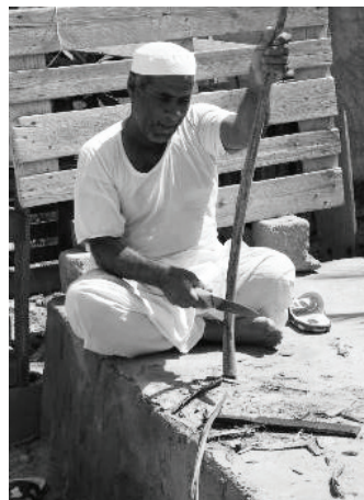
تصویر ۴: پاک‌کردن برگ‌های درخت خرما (پیش به گویش محلی) از گردهای درخت خرما (گرد به گویش محلی).