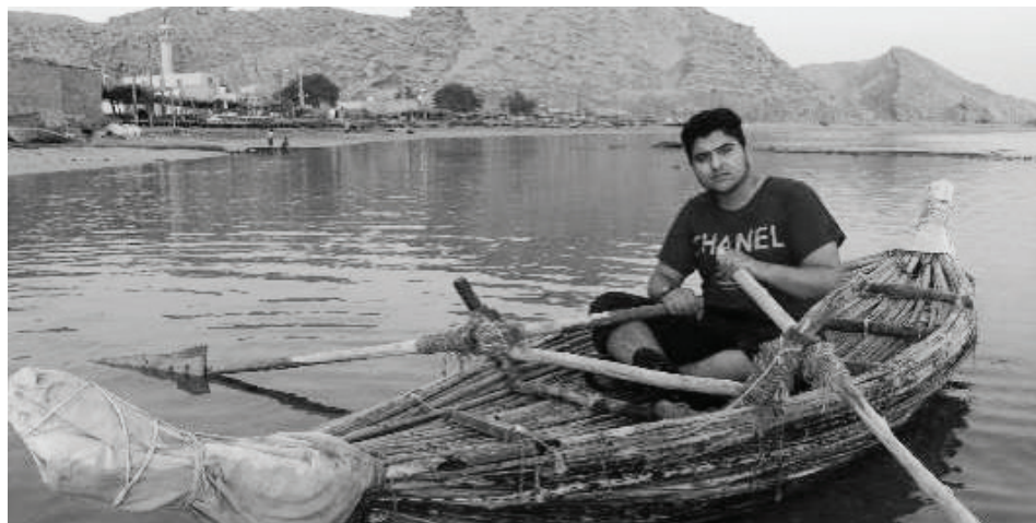
۷- کاربرد شاش