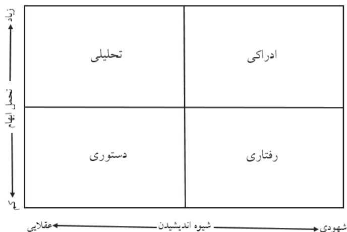
شکل ۲: سبک‌های تصمیم‌گیری راو و بلوگرید

هانت و همکاران (۱۹۸۹) سبک‌های تصمیم‌گیری را در سه دسته سبک تحلیلی، شهودی و آمیخته ۲ در نظر گرفتند. سبک آمیخته توجه توأمان به هر دو سبک تحلیلی و شهودی است (Thunholm, 2004). با توجه به اینکه این سبک‌ها پیش‌تر معرفی شده‌اند، از توضیح مجدد اجتناب می‌شود.